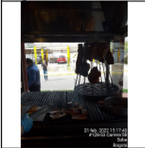
Fotografía No. 3 Horno tipo trompo