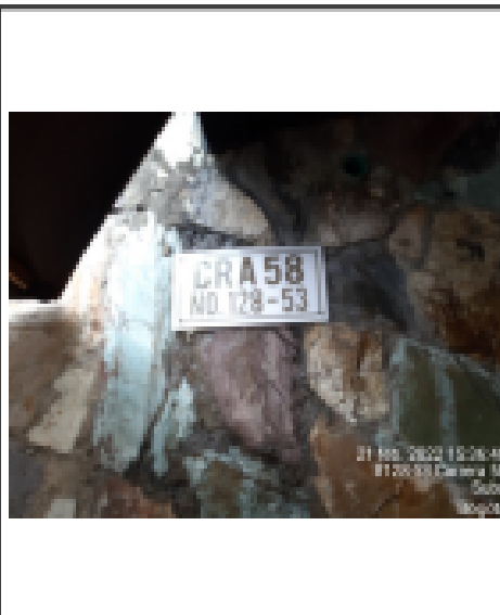
Fotografía No. 2 Nomenclatura urbana