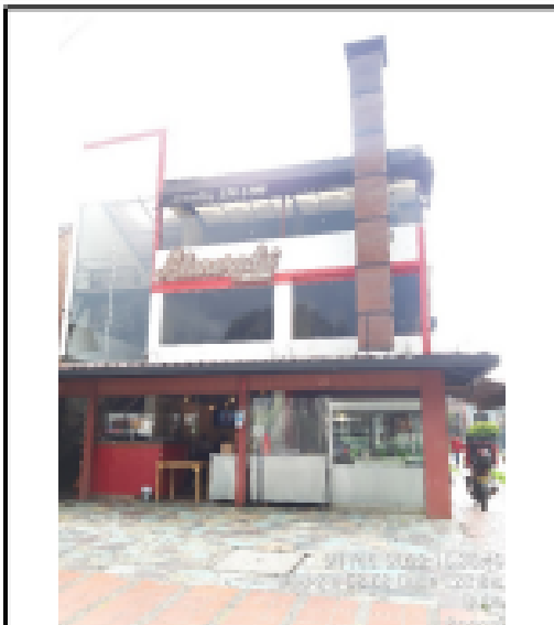
Fotografía No. 1 Fachada del establecimiento