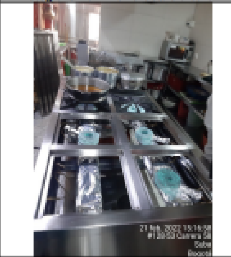
Fotografía No. 4 Estufa